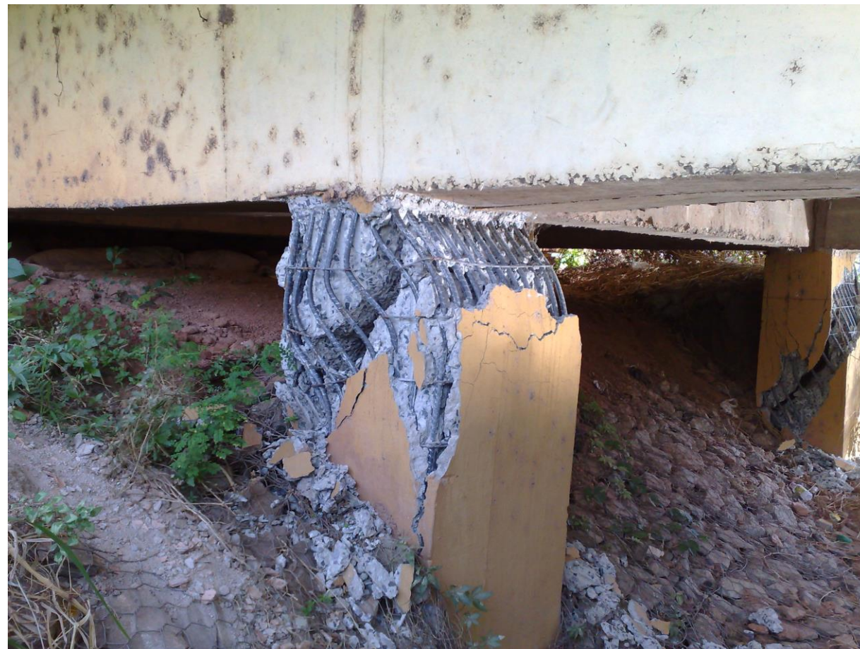
IX Webinar Ibape – Clémenceau Chiabi